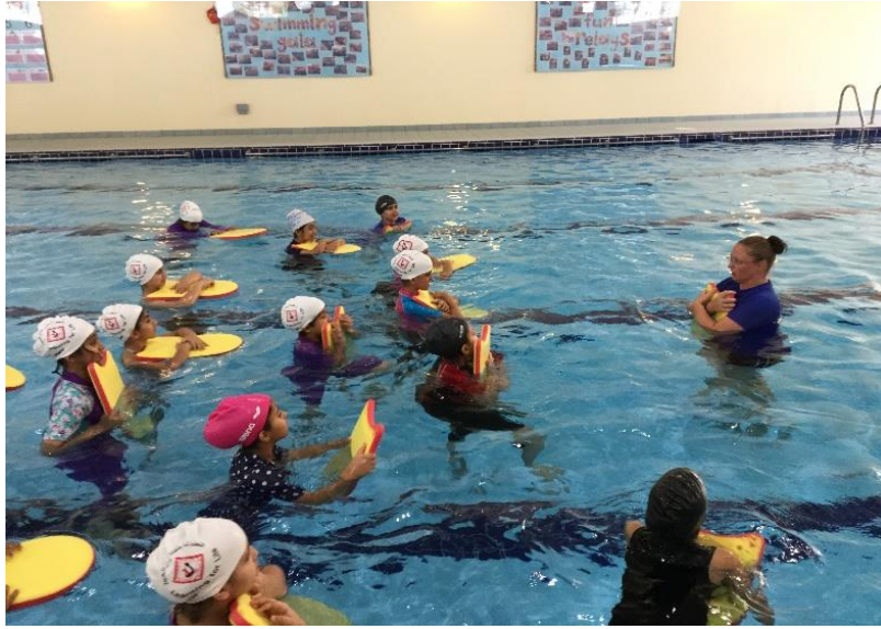
30:30 Fitness Challenge تحدي اللياقة 30:30

أظهرت الأبحاث أن المواظبة على فعل الشيء بشكل يومي لمدة ثلاثين يوماً، يؤدي إلى اكتساب عادة جديدة.