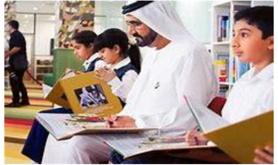
LSG 30:30 Reading Challenge تحدي مدرسة لطيفة للقراءة 30:30